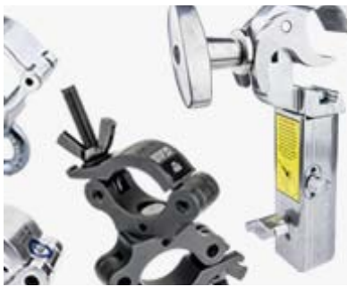
COUPLER & CLAMP

Abrazaderas, acopladores, cables de seguridad y soporte, que ofrecen múltiples soluciones para instalar accesorios de iluminación. Muchos de estos productos tienen certificación TUV gracias a su confiabilidad. Los cables de seguridad están contruidos de conformidad con CE, brindando seguridad secundaria para los accesorios de iluminación cuando ocurren accidentes inesperados. El soporte certificado por TUV con un mecanismo único y patentado de bloqueo automático proporciona una manera simple y sin esfuerzo de elevar luminarias o estructuras.