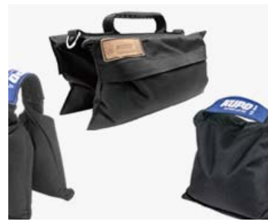
SAND & SHOT BAG